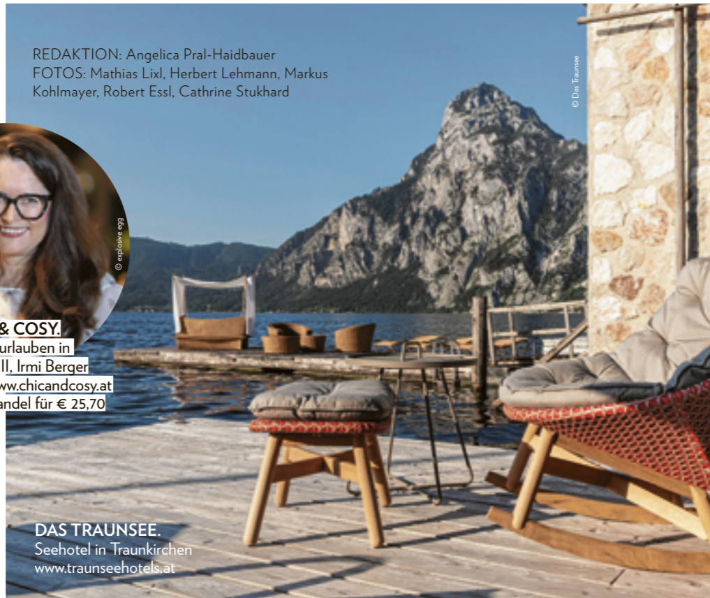
DAS TRAUNSEE. Seehotel in Traunkirchen www.traunseehotels.at

In „chic & cosy“, ihrem bereits dritten Hotel-Guide, beschreibt die Autorin frisch und fröhlich weitere Hotspots der österreichischen Hospitality auf hochwertigem Munkel-Papier. „Es gibt so viele schöne Flecken in unserem Land, die es zu entdecken gibt, und mein Guide soll dazu animieren. Vor allem auch, weil Urlauben im eigenen Land auch heuer voll im Trend liegt!“, macht Irmi Berger Lust beim Schmökern nach neuen Lieblingsplätzen. Wir haben uns in echter Qual der Wahl aus der Fülle an einzigartigen Locations auf besondere Hausarten konzentriert – für unvergessliche Urlaubstage in Österreich!