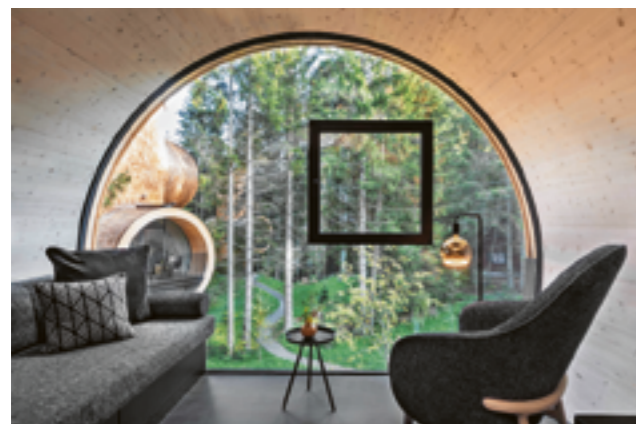
Schlafen wie in Pinocchio's Nase.