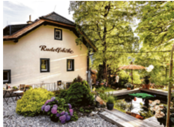
IDYLLE PUR auf 1.200 m Seehöhe.