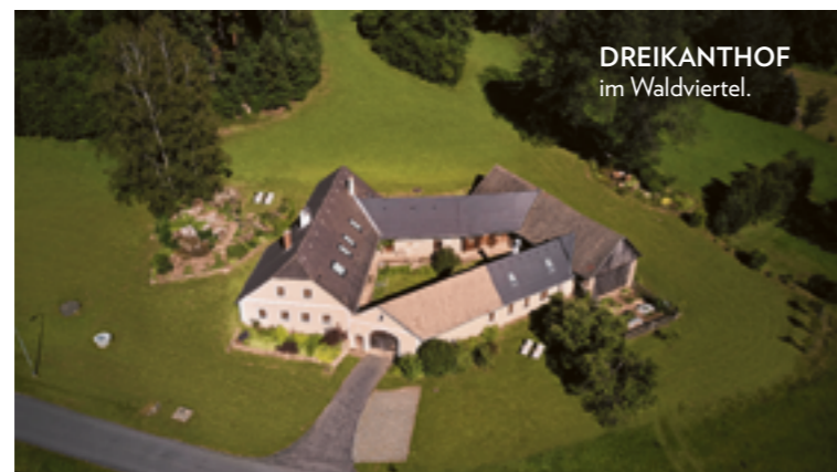
DREIKANTHOF im Waldviertel.