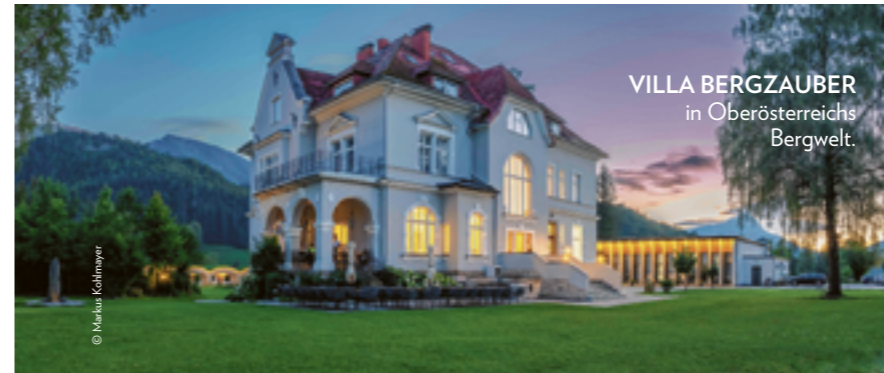
VILLA BERGZAUBER in Oberösterreichs Bergwelt.