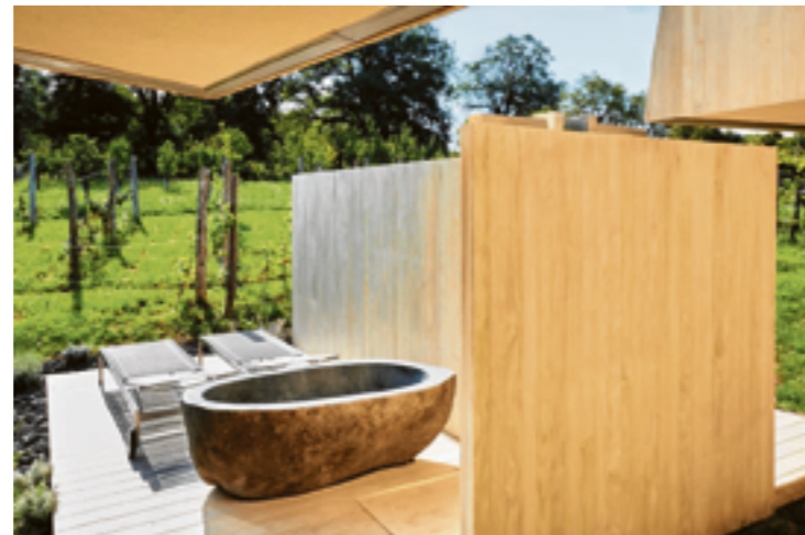
PRIVATER GARTEN mit Open-Air-Dusche.