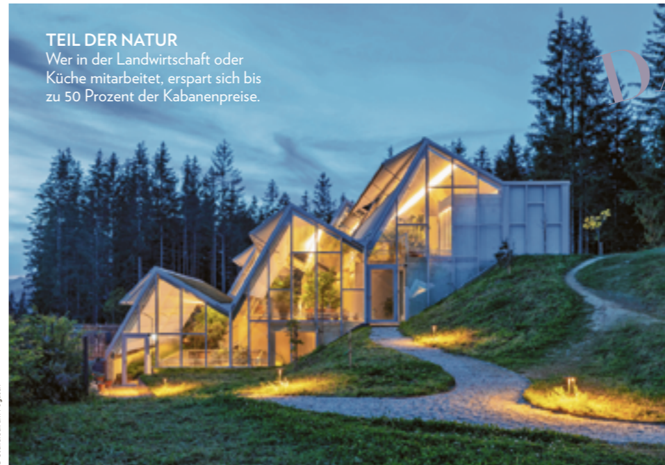
TEIL DER NATUR Wer in der Landwirtschaft oder Küche mitarbeitet, erspart sich bis zu 50 Prozent der Kabanenpreise.

Hier kann man auf 1.100 Metern Seehöhe sogar sein eigenes „Himmelreich“ in Form eines Baumhauses mieten. Seit 2022 werden die überdimensionalen Holzstämme mit einem Innenleben auf drei Etagen bewohnt – mit einem Blick vom Bett direkt auf Wald und Wiese, der unglaublich ist. Und weil das Waldbaden auch hungrig macht, gibt es im wohl berühmtesten Landgasthaus Österreichs, nur ein paar Schritte entfernt, von Donnerstag bis Sonntag gehobene Wirtshausküche mit Produkten aus eigener Landwirtschaft.