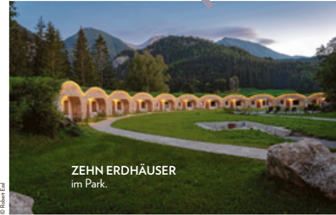
ZEHN ERDHAUSER im Park.