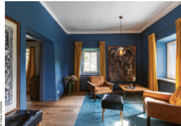
KLASSISCH Gemütlichkeit im 600 Jahre alten Gemäuer.