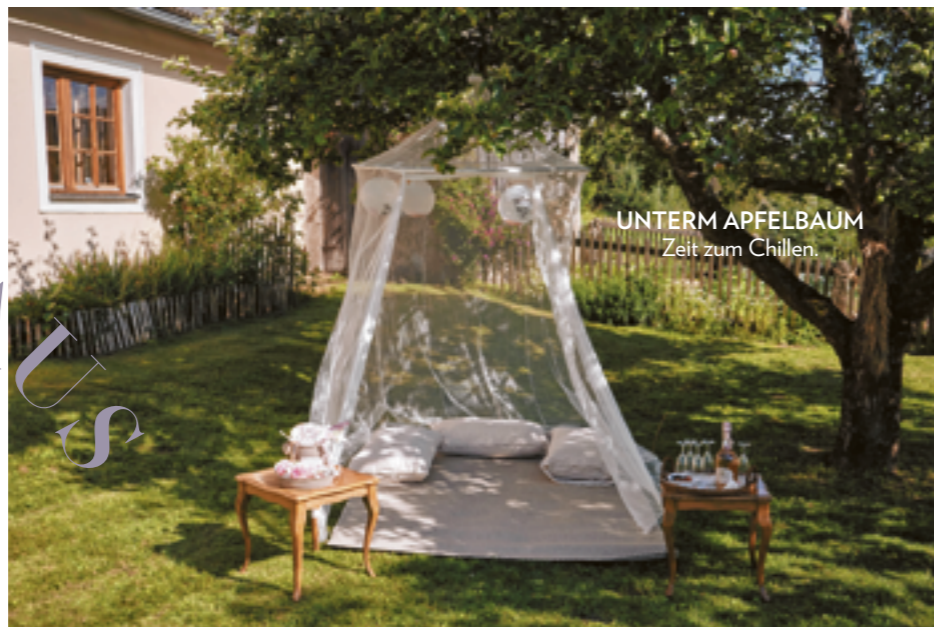
UNTERM APFELBAUM Zeit zum Chillen.