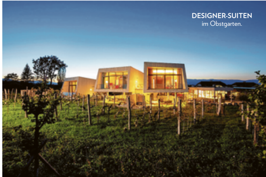
DESIGNER-SUITEN im Obstgarten.