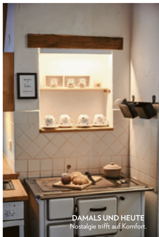
DAMALS UND HEUTE Nostalgie trifft auf Komfort.