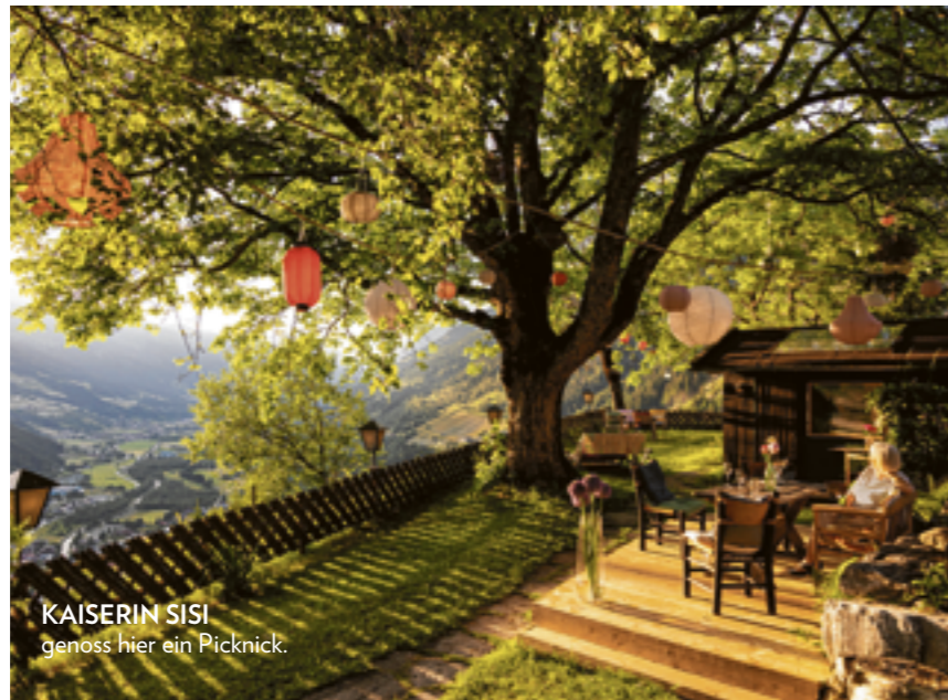
KAISERIN SISI genoss hier ein Picknick.