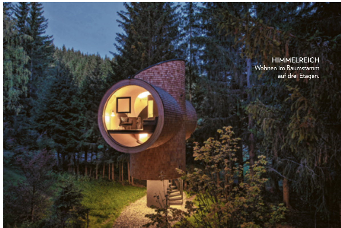
HIMMELREICH Wohnen im Baumstamm auf drei Etagen.