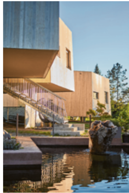
GUNTRAMS 11 am Badeteich.